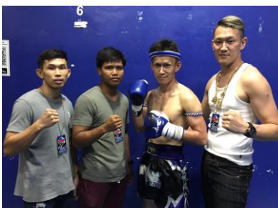
試合前の記念撮影

山形県タイ友好協会員のYs.k KICK BOXING GYM 御一行様がタイで開催されるムエタイの試合参加のため訪タイされました。パタヤで行われた試合はテレビ中継が入るほど大きな試合で、ムエタイ初観戦の私は会場の熱気や想像以上の迫りに圧倒されました。山形から参加した選手2名の試合結果は残念ながら敗戦となってしまいましたが、本場タイで初めてムエタイの試合を行ったことは、貴重なご経験となったようです。