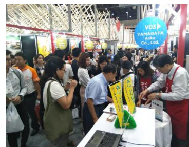
①展示ブース前に集まる来場者

5月28日～6月1日にかけてバンコク北部にてタイ国内最大級の食品総合見本市「THAIFEX-World of Food Asia 2019」が開催され、タイ国内外から約7万人の来場者で賑わいました。山形県からは山形県国際経済振興機構のサポートの下、山形県食肉公社様、山形飛鳥様が出展され、試食として用意された山形牛や酒田の新鮮なイカの加工品（塩辛等）は現地でも大変人気を博しており、将来的な販路拡大への手応えが感じられる展示会となりました。