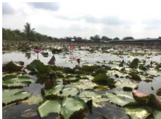
ボートからの蓮池の様子

6月には行動制限措置の追加緩和が予定されるため、観光も含め少しずつ活動が再開されてきています。