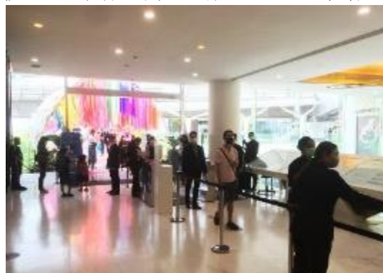
入店待ちの様子と誘導スタッフ